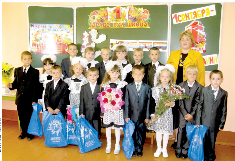
Хочется, чтобы школьная жизнь стала для первоклассников увлекательной, интересной, полной удивительных открытий

Почти 7 тысяч малышей пошли в первый класс