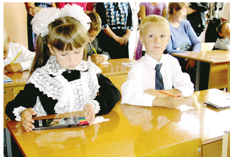
Энергетики надеются, что их подарки помогут малышам в учебном процессе