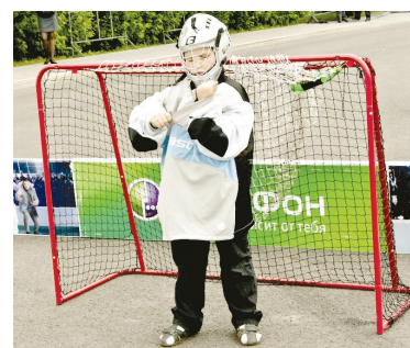
«Большие игры МегаФон» стартовали 14 мая 2011 года

под выступление местных коллективов, для которых Фестиваль инноваций и спорта может стать стартовой площадкой успеха.